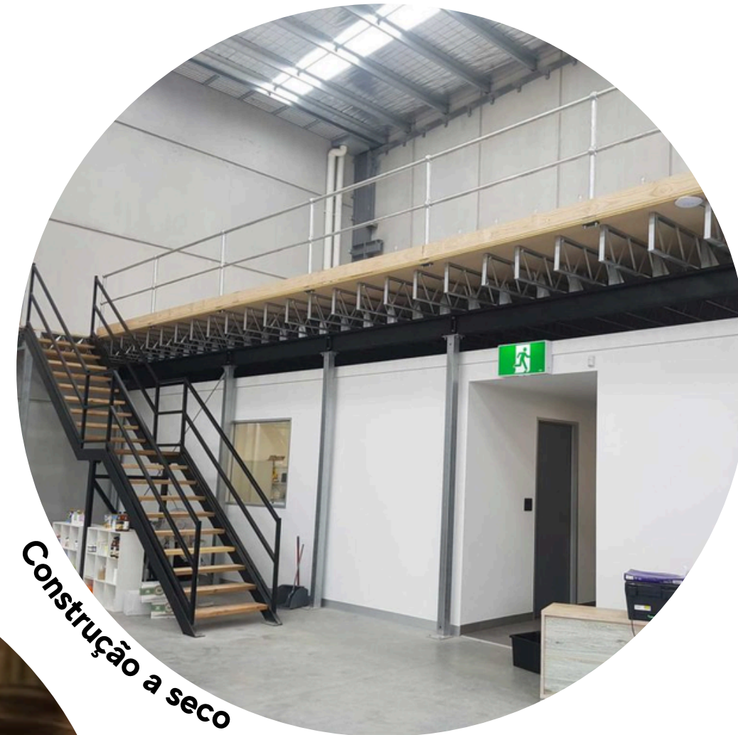
Construção a seco